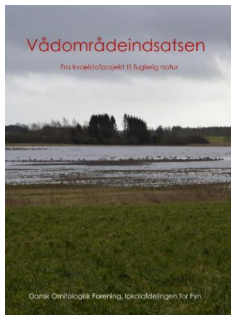
Forsiden af DOF-Fyns inspirationskatalog 2017 om Vådområdeindsatsen

Efter strukturreformen i 2007 nedsattes der i kommunerne et Grønt Råd. Undertegnede fik DOF's plads i Svendborg Kommunes Grønne Råd og har haft denne repræsentation uafbrudt lige siden. Denne platform har været benyttet til gentagne gange at foreslå grønne initiativer. Altid på baggrund af grundigt forarbejde både i felten og ved skrivebordet. Ofte har der således været bidrag til selve dagsordenen i Grønt Råd. Også om vådområdeindsatsen, fx som punkt 7 på Grønt Råds møde den 21. februar 2018. Forinden havde DOF-Fyn i 2017 udarbejdet og afleveret et inspirationskatalog til kommunen, benævnt "Vådområdeindsatsen. Fra kvælstofprojekt til fuglerig natur". Heri redegøres for, hvordan et kvælstofprojekt kan udformes, så det